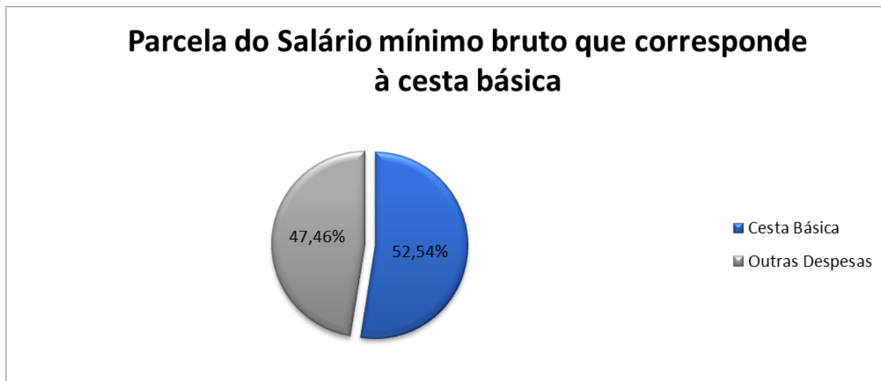
Figura 1: Parcela do salário mínimo correspondente à cesta básica