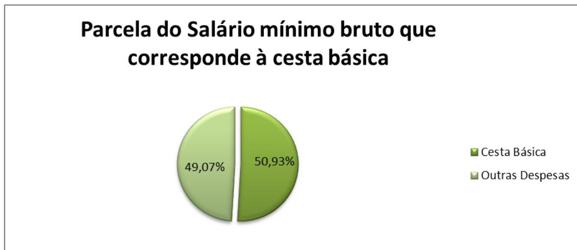
Figura 1: Parcela do salário mínimo correspondente à cesta básica