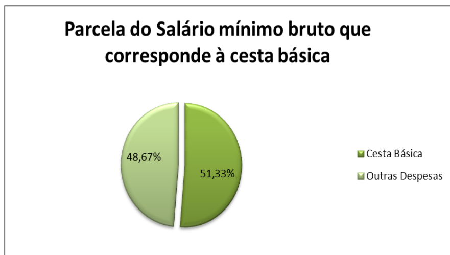
Figura 1: Parcela do salário mínimo correspondente à cesta básica